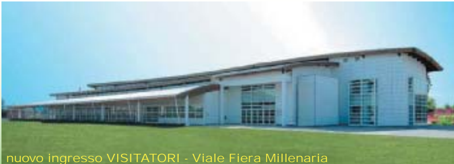
nuovo ingresso VISITATORI - Viale Fiera Millenaria