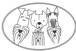
SLOVENSKI KLUB ZA TERIERJE